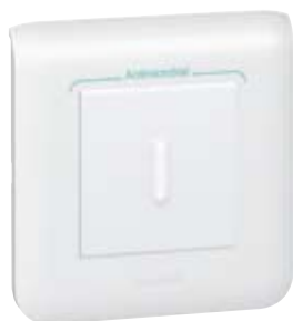
787 12 + 787 22