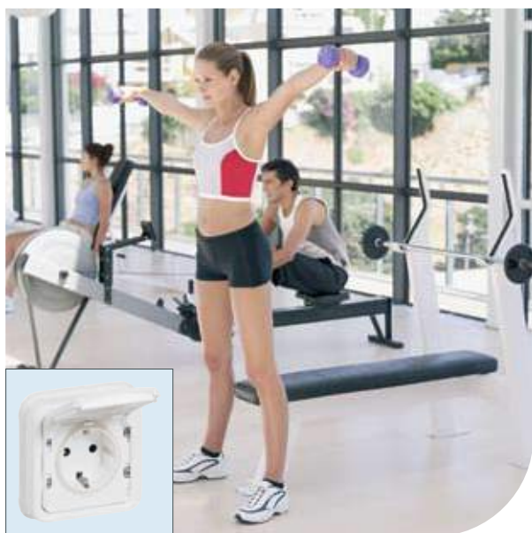
Фитнесс-клубы | Plexo™ Artic | Розетка 2К+3