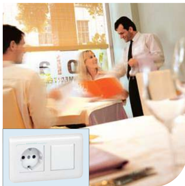
Рестораны | Mosaic™ | Розетка 2К+3 и выключатель