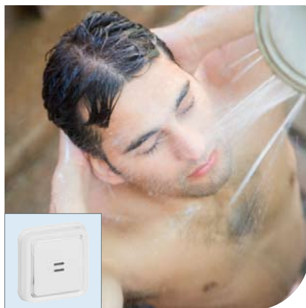
Бассейны | Plexo™ Artic | Выключатель с индикатором