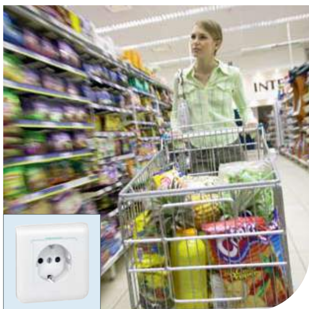
Супермаркеты | Mosaic™ | Розетка 2К+3