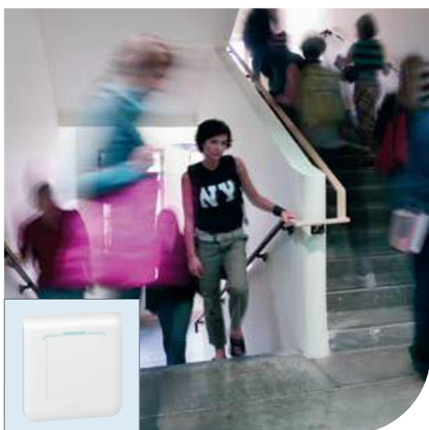
Образовательные учреждения | Mosaic™ | Выключатель одноклавишный