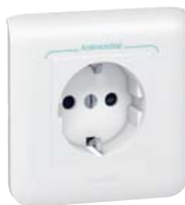
787 02 + 787 22