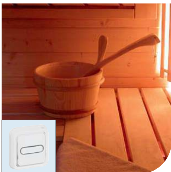
Сауна | Plexo™ Artic | Кнопочный выключатель с подсветкой