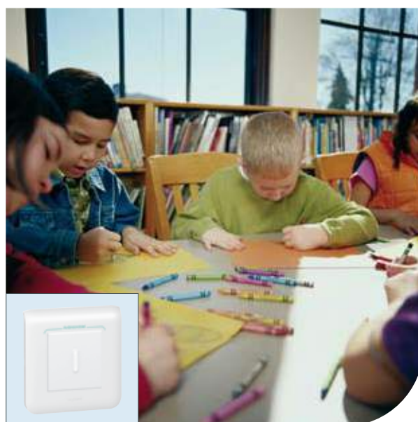
Дошкольные учреждения | Mosaic™ | Выключатель на 2 направления